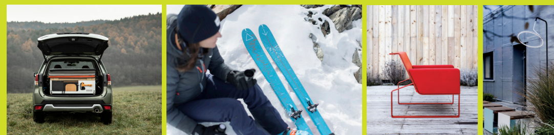
campingebauten sportausrüstung außenmöbel

Seien es Möbel oder Bahnhöfe, das Endprodukt stellt immer die Verwirklichung der Idee, ihre Materialisation dar. Die Lösung darf nicht zu Selbstzwecken dienen, sondern immer Zusammenhänge respektieren. Sie spricht für ihre Autoren.