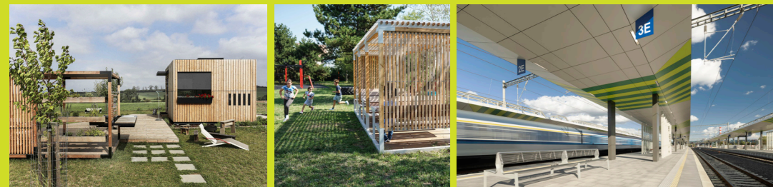
Ulita Leva verkehrsbauten